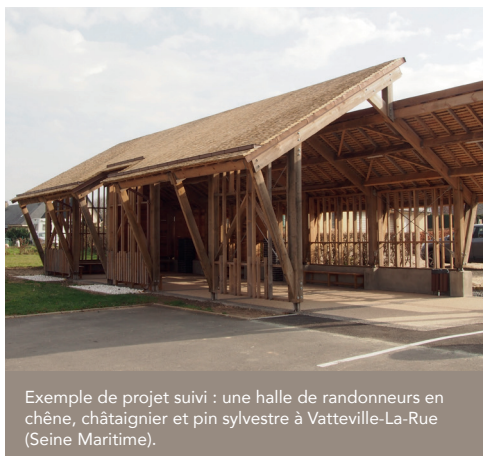
Exemple de projet suivi : une halle de randonneurs en chêne, châtaignier et pin sylvestre à Vatteville-La-Rue (Seine Maritime).

* Territoire français dans un rayon de 80 km autour du projet